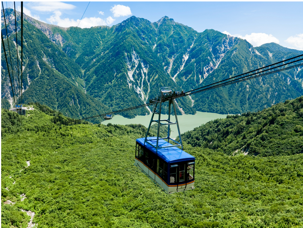
(写真提供：立山黒部アルペンルート 立山ロープウェイ イメージ)