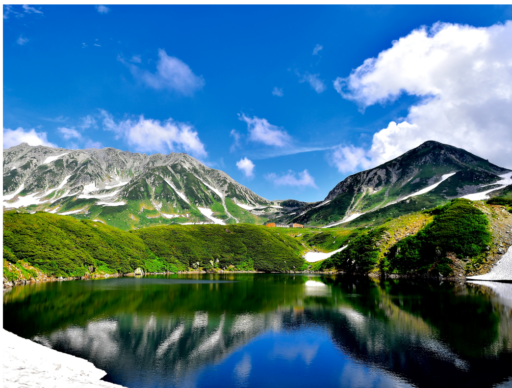
(写真提供：立山黒部アルペンルート みくりが池 イメージ)