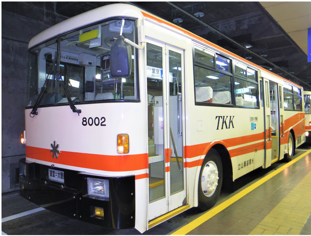
(写真提供：立山黒部アルペンルート 立山トンネルトロリーバス イメージ)