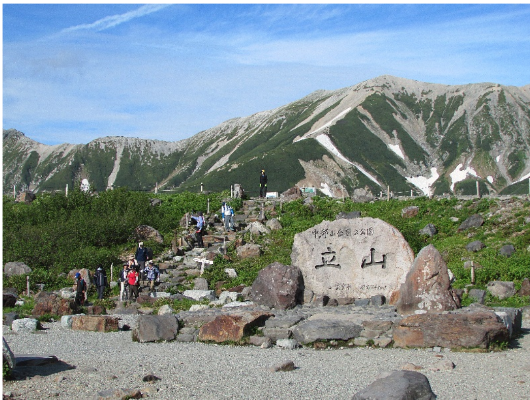
(写真提供：立山黒部アルペンルート 立山石碑 イメージ)