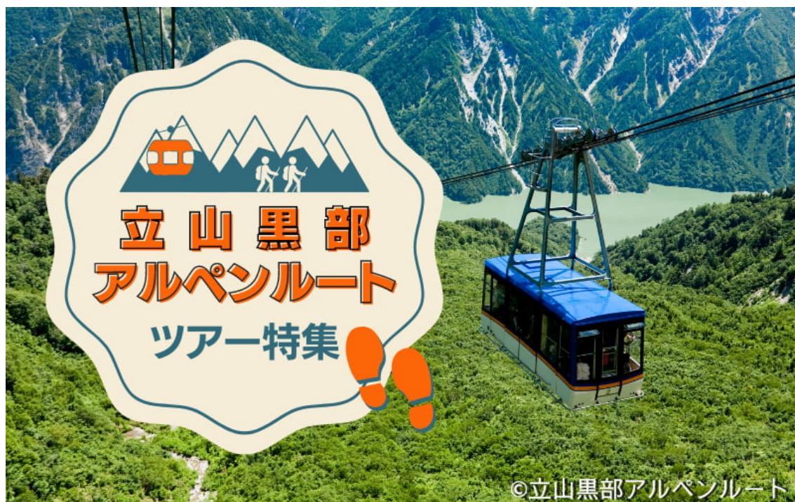
(特集ページイメージ)

ビッグホリデー株式会社(本社：東京都文京区、代表取締役社長：岩崎 安利)は、このたび「雲上に広がる雄大な大自然を満喫！立山黒部アルペンルートへの旅」を2023年5月18日より販売開始いたしました。「立山駅→扇沢」通り抜けコース・「扇沢→立山」通り抜けコース・「扇沢⇄室堂」往復 大町温泉郷宿泊コースと初心者でも気軽にご参加いただける幅広いラインアップを取り揃えています。普段なかなか乗ることのない様々な乗り物を使いながら、絶景の立山黒部アルペンルートをぜひこの機会にお楽しみください。