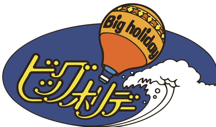
(ビッグホリデーロゴ)

2024年には創業60周年を迎えます。これからも一人でも多くのお客様に旅行を含めた余暇の楽しみ方を提供し、お客様と共に歩み続けてまいります。