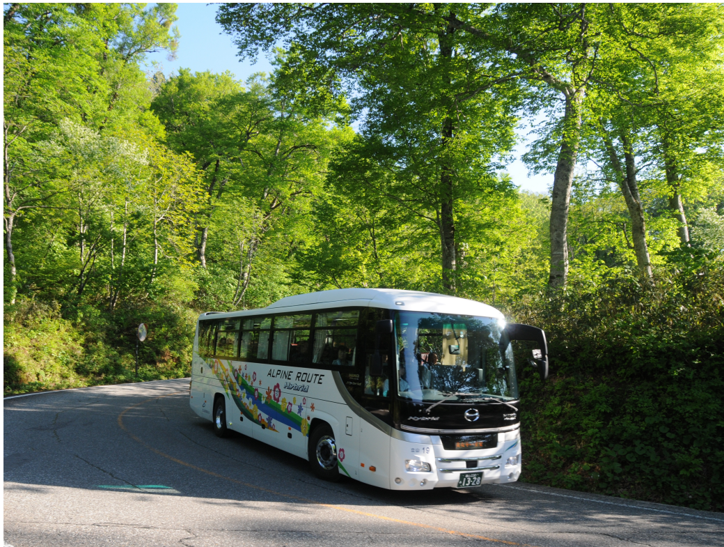
(写真提供：立山黒部アルペンルート 立山高原バス イメージ)

アルペンルート内へは一般車両の通行はできません。移動交通機関は、自然の変化を楽しめる高原バス、360度のパノラマが展望できるロープウェイ、全線地下式ケーブルカー、黒部ダム建設時に用いたトンネルを通るトロリーバスなど、様々な特長のある6種類の乗り物を乗り継ぎます。