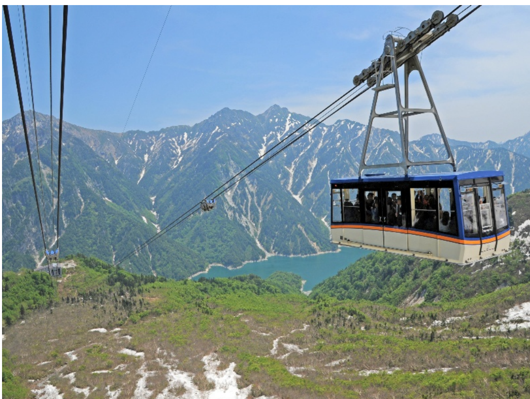
(写真提供：立山黒部アルペンルート 立山ロープウェイ イメージ)