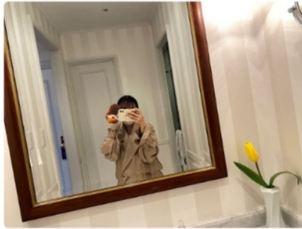
(旅コラムイメージ)

はじめまして！今回、私が考える旅行企画のテーマは「推し×ひとり旅」。大好きな旅行と推しを掛け合わせたら、楽しいに決まっている！1人でも推しと一緒になら、テーマパークだって楽しめちゃう！ということ。推しと写真を撮るハウステンボスのおすすめフォトスポットや園内の美味しいグルメを食べて楽しんできたいと思います！（取材日：2023年3月7日）