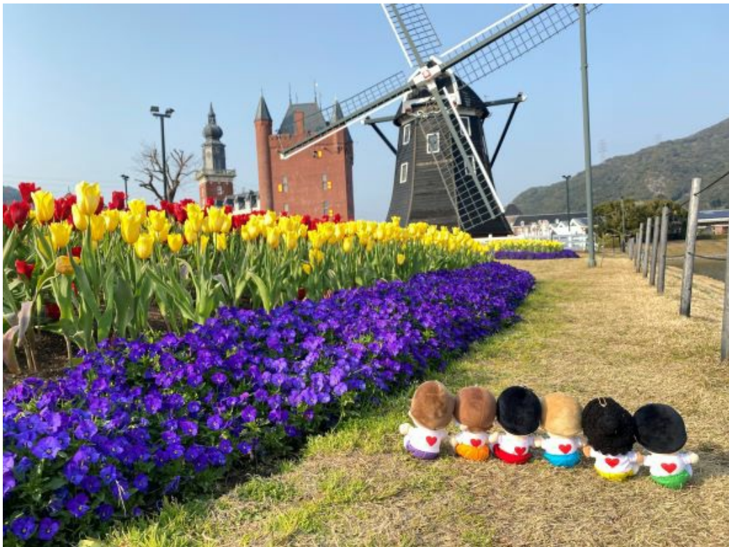
(フラワーロードとぬい)

色とりどりのレンガの街並。向かいのロールアイス屋さんでアイスを買って、推しと一緒に写真を撮ったら可愛さ倍増間違いなし！