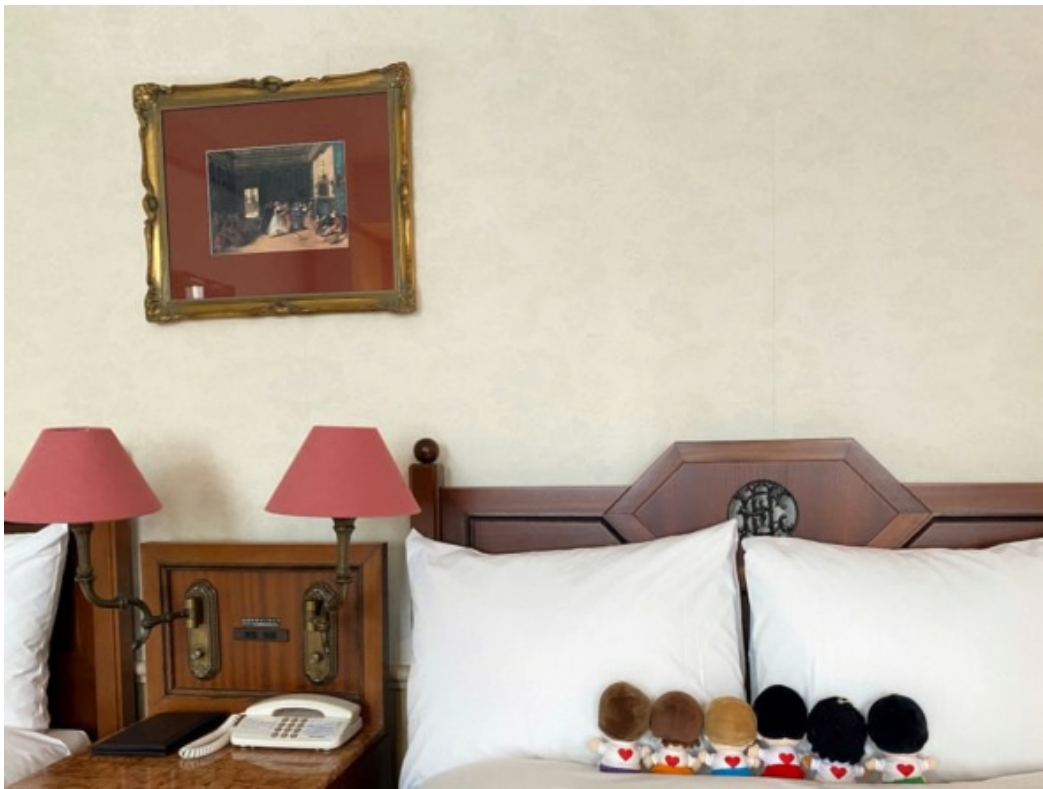
(ホテルヨーロッパ客室とぬい)

客室内はクラシカルなインテリアが揃っており、優雅なひとときを過ごすことができますでしょう。ベッドの上にぬいを並べてみるだけでも異国の雰囲気が漂いますね！