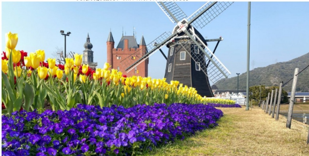
ひとり旅でも推しと楽しむ！ハウステンボスでフォトジェニックなひと時を

ビッグホリデーTOP > Travel Blog > ひとり旅でも推しと楽しむ！ハウステンボスでフォトジェニックなひと時を