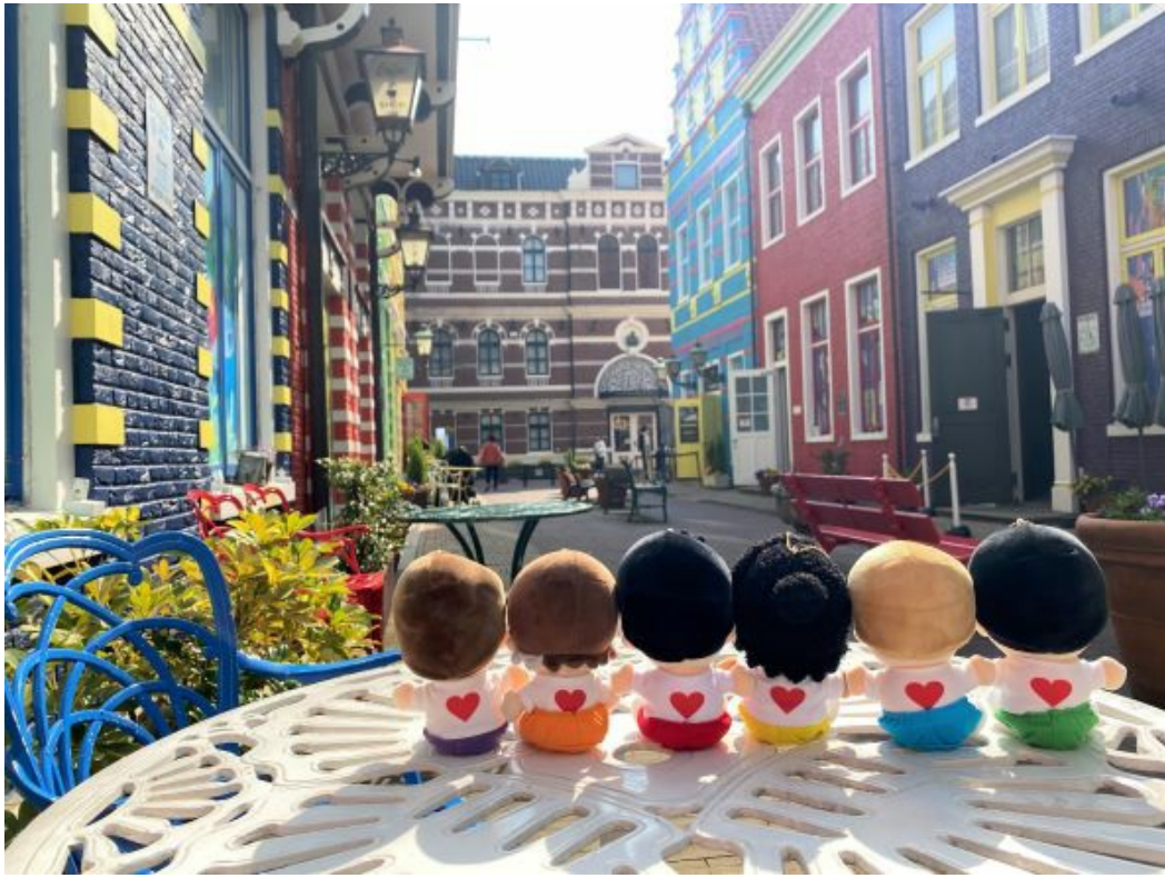
(ファンタジアストリートとぬい)

色とりどりのレンガの街並。向かいのロールアイス屋さんでアイスを買って、推しと一緒に写真を撮ったら可愛さ倍増間違いなし！